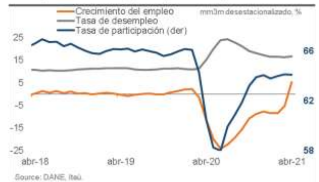
Recuperación de la ocupación pero desempleo urbano aún