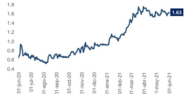
Estados Unidos Tasa de negociación Tesoros 10Y

Los bonos del tesoro estadounidense reducen su tasa. Los bonos con vencimiento a 10 años en Estados Unidos registran a esta hora un nivel de 1,63%. Por su parte, en Colombia en la con respecto a la jornada anterior, la curva de TES tasa fija presento una valorización promedio de 6,70 pbs. Los bonos con vencimiento en el 2022 en 2,78%, 6,90 pbs más abajo que la jornada anterior, mientras que, los bonos del 2026 mostraron una tasa de 5,86%, 0,60 pbs más abajo. Así mismo los bonos con vencimiento a 2028, marcaron 6,65% valorizándose 9,00 pbs con respecto a la jornada anterior. Los bonos con vencimiento en 2030 marcan una tasa de 7,19% 8,00 pbs más abajo que en la jornada anterior. En la parte larga de la curva, los títulos con vencimiento en 2032 se valorizaron 9,00pbs marcando 7,51%.