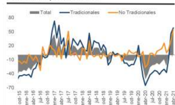
Colombia: Exportaciones a/a