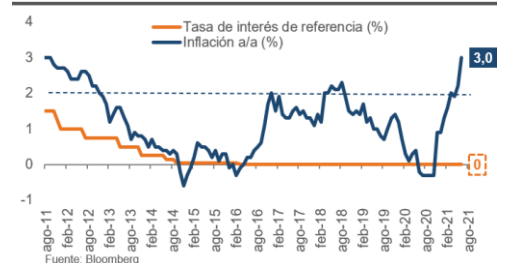
Euro Zona: tasa de depósito e inflación