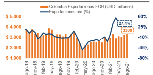
Colombia: Exportaciones FOB

El organismo nacional de estadística publicará el viernes los datos de las exportaciones correspondientes al mes de agosto. En julio, las exportaciones aumentaron un 27,4% interanual, lo que supone una moderación con respecto al aumento del 33,1% de junio, ya que las ventas exteriores se encontraron con una base de comparación más elevada. Las exportaciones de petróleo subieron 27,0% interanual, moderándose desde el aumento de 79,6% del mes anterior. Las exportaciones de los bienes no tradicionales subieron 27,4% interanual, lo que refleja el benigno panorama externo y la normalización de las operaciones comerciales (tras las protestas a principios de año). Para el mes de agosto estimamos unas exportaciones de USD3.300 millones, lo que supone un aumento anual del 29,2%. En adelante, esperamos un déficit de cuenta corriente de 4,6% del PIB para este año, desde un déficit de 3,4% el año pasado. Una recuperación gradual de la demanda interna y un mayor déficit de ingresos compensarían el efecto positivo sobre las exportaciones de mayores términos de intercambio y una recuperación de la demanda mundial.